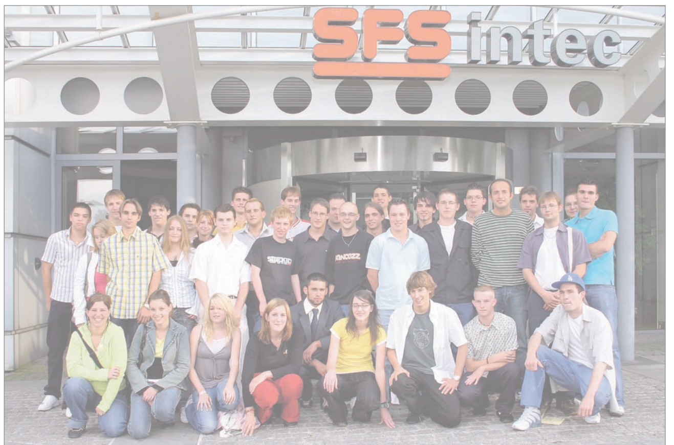
Die erfolgreichen Lehrabgängerinnen und Lehrabgänger strahlen um die Wette.

Eine Etappe sei nun gewonnen, so Fiechter, aber noch nicht das Rennen. Es